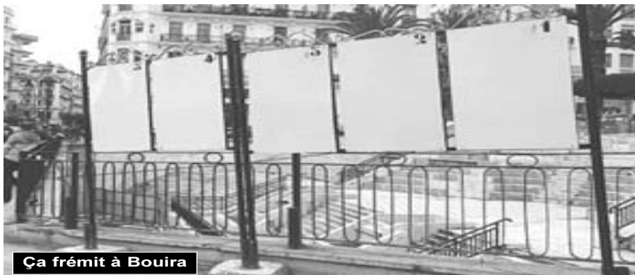
Ça frémit à Bouira