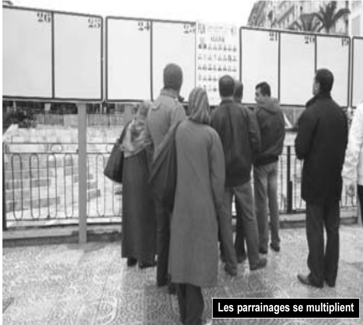
Les parrainages se multiplient

DES formations n'ont présenté que peu de leurs militants aux joutes prochaines.